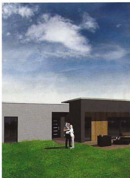
Projet de maison Kub'enboa.

Les familles d'aujourd'hui s'intéressent davantage aux ossatures bois pour vivre dans un lieu plus écologique.